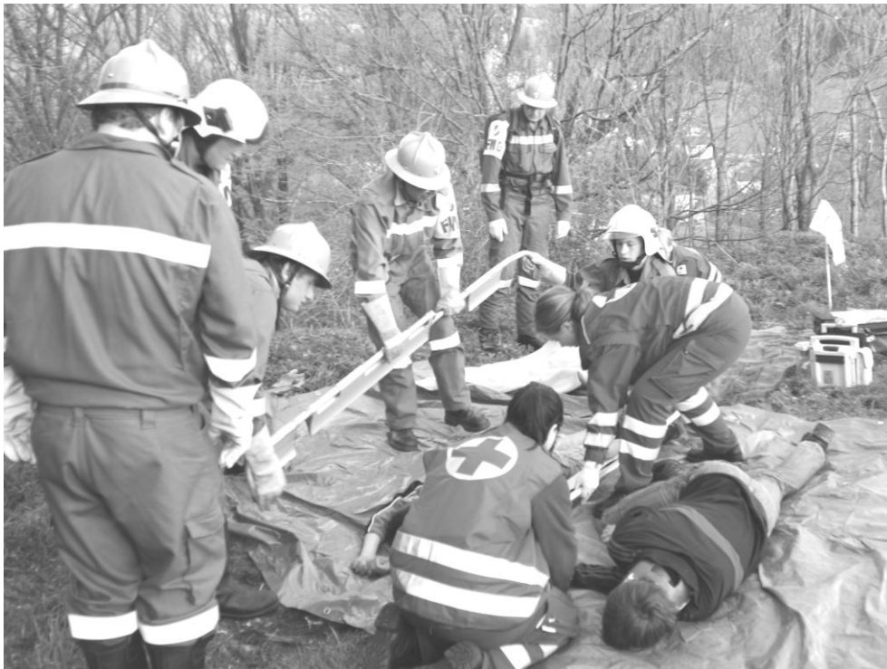
April: Übung gemeinsam mit dem Roten Kreuz Kirchschlag am Güterweg Lobenstein

März: Bergeausrüstung, Güterweg Obergeng